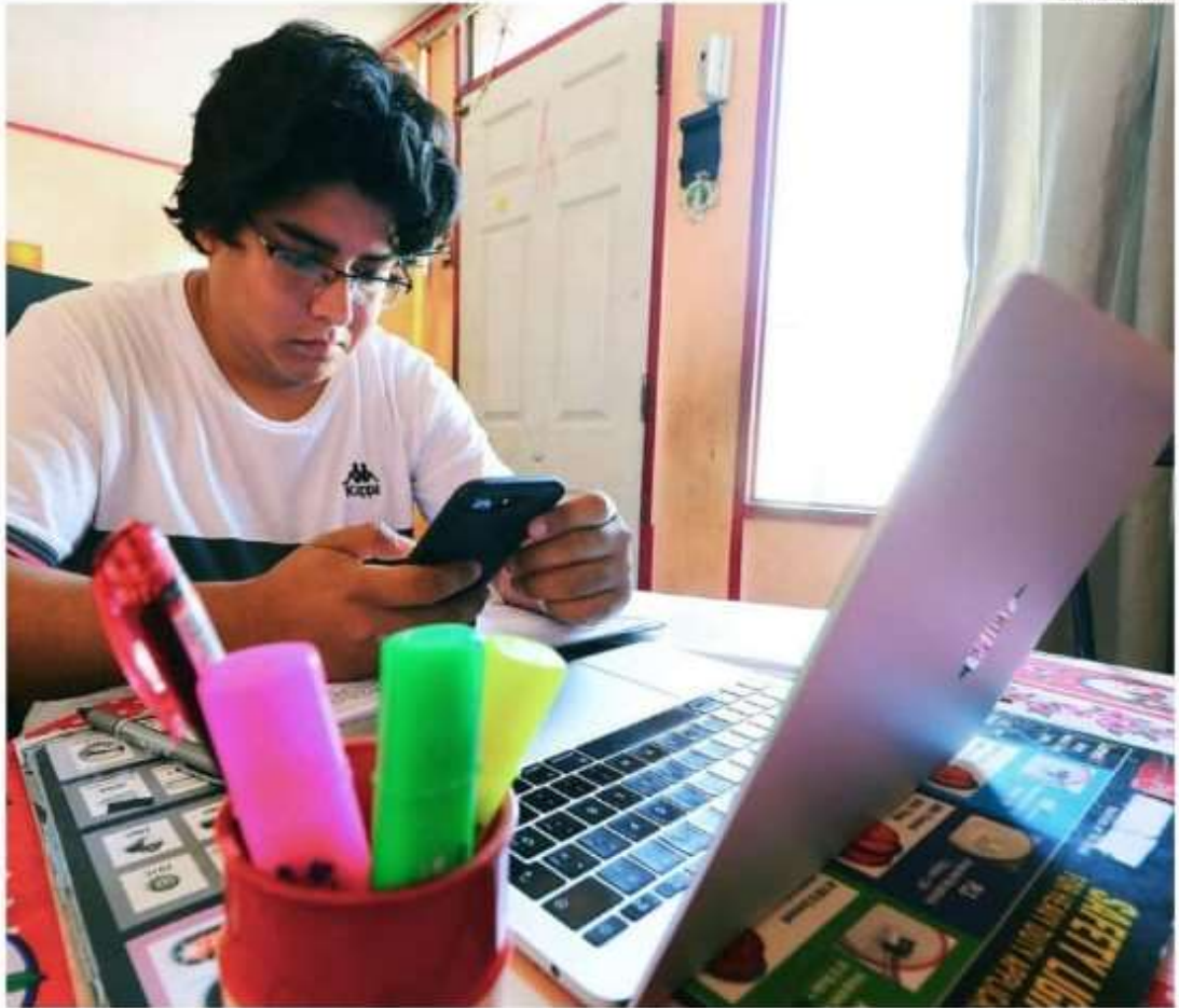
LA PANDEMIA IMPUSO NUEVOS DESAFÍOS PARA LOS DOCENTES, COMO LAS CLASES ONLINE.

En el caso de la Facultad de Educación de la USS "lo que