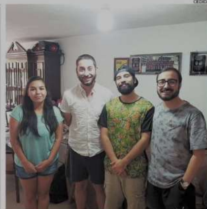
LOS JÓVENES YA ESTÁN EN CIUDAD DE MÉXICO.

Existe, con este tipo de prácticas, un cambio filosófico y práctico de la manera de tratar a los usuarios, según la académica, que no deja de lado a la familia ya que al mantener estas redes beneficia la salud y bienestar no solo del usuario directo, sino también del grupo con mayor significado para quien sufre de problemas cognitivos. CS