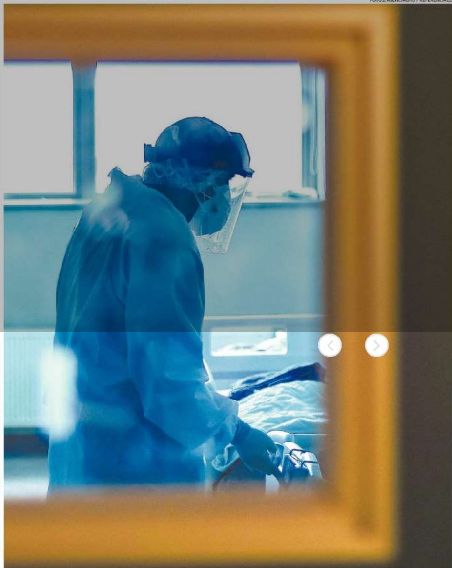
QUE DEBEN ENFRENTAR AQUELLOS PACIENTES CON COVID-19 QUE SUFREN INFECCIONES MÁS GRAVES.

“ Los pacientes nos van orientando con sugerencias para ayudar en el futuro a otras personas”.