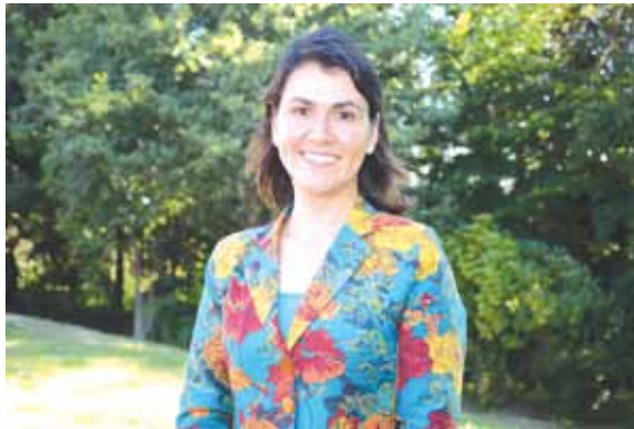
La Dra. Vera es Psicóloga, Magíster en Educación y Doctora en Ciencias de la Educación.

En entrevista, la nueva Vicerrectora abordó los principales desafíos de una gestión que coincide con un momento histórico relevante que exige a la Universidad una mayor vinculación con su entorno. "A lo largo de los años, la Sede Puerto Montt se ha convertido en un referente en la Región de Los Lagos, posicionando a la UACH como la institución líder en educación superior de la zona, esto significa que el trabajo se ha hecho con compromiso y dedicación y es algo que se debe cuidar y por lo cual se debe seguir trabajando. Hoy nos encontramos como sociedad en